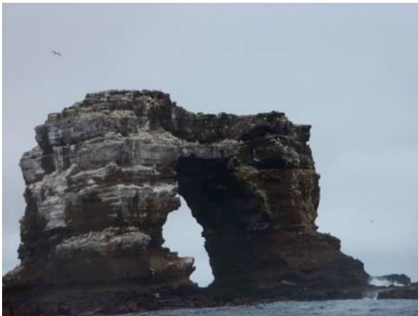
„Darwin`s Arch“, Foto: Simone Dorenburg