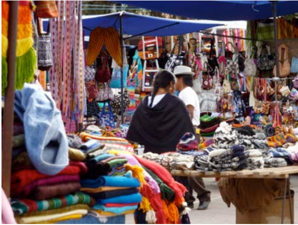
„Indomarkt in Otavalo“, Foto: Simone Dorenburg