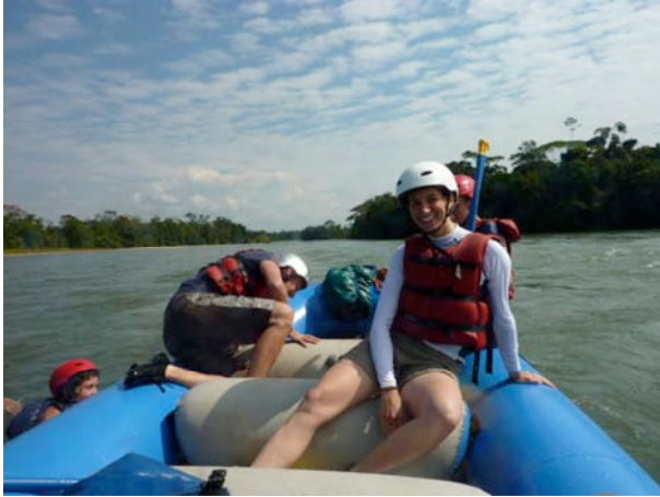
„Rafting Rio Napo“

5. Tag: Alles Gute hat ein Ende.... Und so leid es uns tut ist es auch bei uns so. Wir möchten Sie ein letztes Mal mit unserem speziellen Frühstück verwöhnen und Ihnen das Beste für Ihre Reise wünschen. Vergessen Sie nicht: Kostenlose Reisetipps sind in unserem Service inklusive. Wenn Sie länger als bis 10:00 h morgens in der Lodge bleiben wollen, fragen Sie uns nach unserem Spät-Check-out. Rückkehr nach Quito.