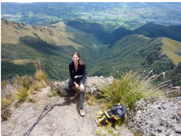
„Gipfel des Pasochoa“, Foto: Simone Dorenburg

7. Tag: Am heutigen Tag besteigen wir den 4.690 Meter hohen Rucu Pichincha. Wir verlassen Quito am Morgen und fahren mit unserem Auto bis Cruz Loma, welches zirka 10 km westlich der Hauptstadt liegt. Von dort aus sind es dann noch weitere 3 Stunden bis zum Gipfel. Am späten Nachmittag sind wir zurück in Quito. Dieser Ausflug ist als ein privater Ausflug nur für Sie organisiert.