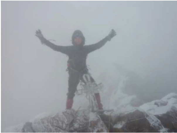
„Gipfel des Iliniza Norte“

8. Tag: Heute besteigen wir den 4200 Meter hohen Pasochoa. Wir verlassen Quito am Morgen und fahren über die Panamericana zum Fuß des erloschenen Vulkans. Die Besteigung wird etwa 4 Stunden dauern. Auf dem Gipfel werden wir einen Snack zu uns nehmen und vor allem einen großartigen Blick auf den Cotopaxi und die anderen nahe liegenden Vulkane haben. Nach dem Abstieg kehren wir nach Quito zurück. Dieser Ausflug ist als ein privater Ausflug nur für Sie organisiert.