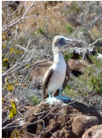
„Junger Seelöwe“, „Fregattvogel“, „Landechse“, „Blaufußtölpel“