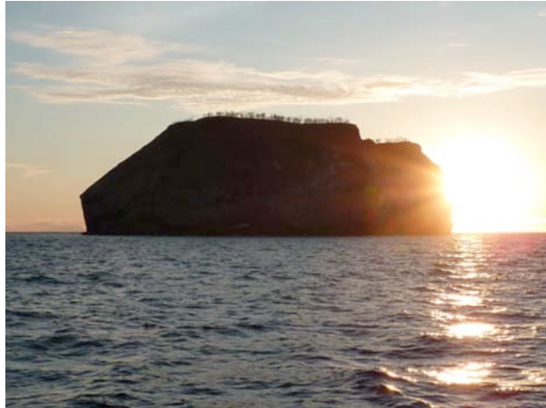
„Wolf“, Foto: Simone Dorenburg